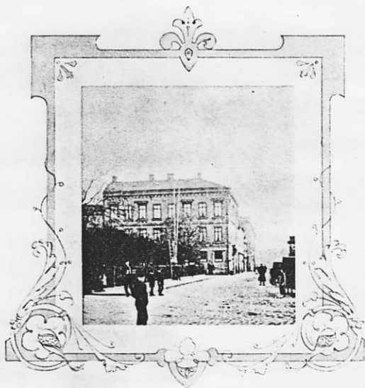
Hammarbergska huset vid Vestra Hamngatan i Göteborg.