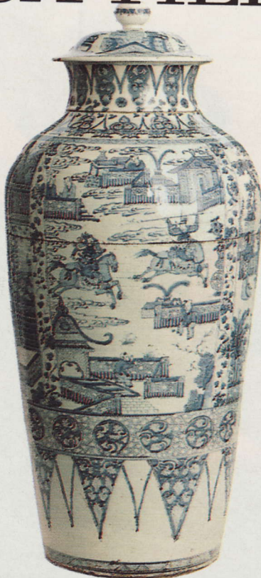
Monumentalvas i underglasyrblått från Kangxi-perioden (1662–1722). Vasen är 105 cm hög och har motiv med bland annat mandarin till häst och scen med mandarin som ger audiens. (Tidigare Johanneum.)