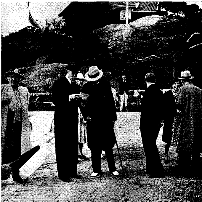
H. M. KONUNGEN PÅ STARTPLATSEN