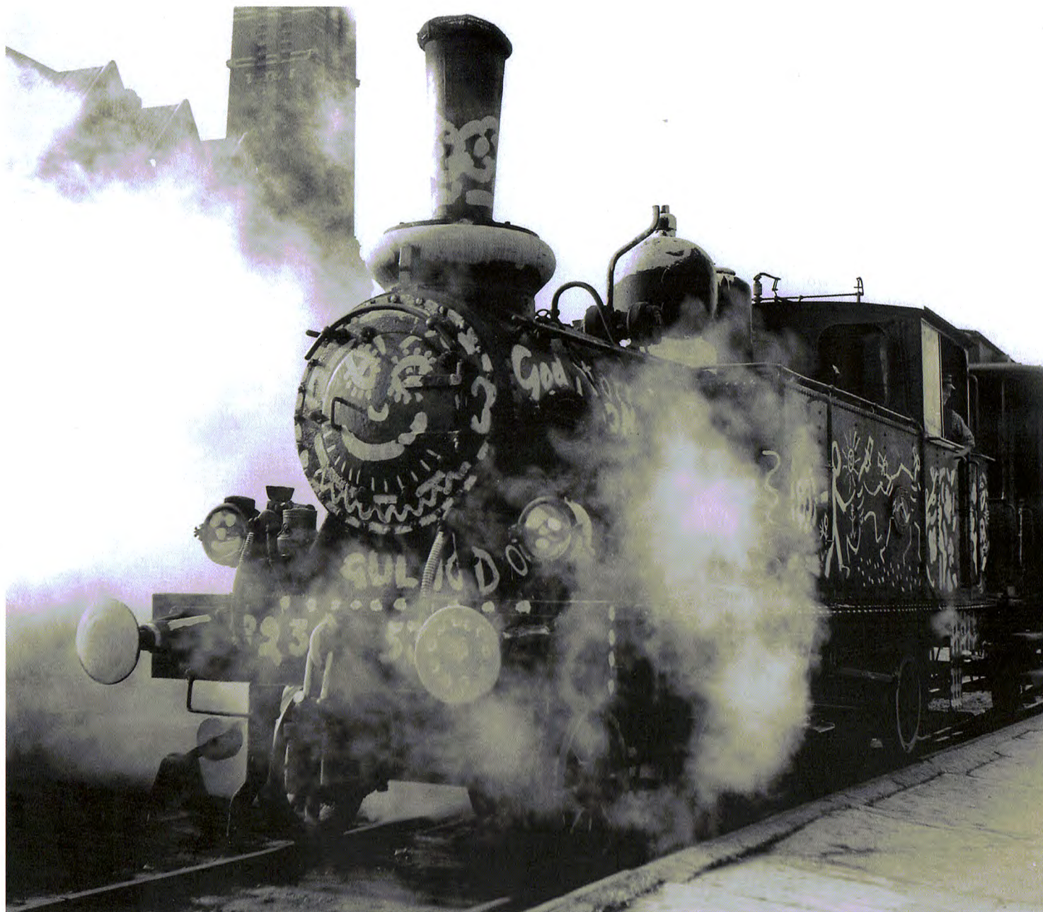
Lok 3 i Göteborg. (BSj)

Ännu ett »färgattentat« hann drabba Säröbanan, innan dess saga blev all. I augusti 1965 befanns hållplatsbyggnaden vid Munkeskullen, som sedan lång tid tillbaka haft sin säregna arkitektur draperad i en smutsgul färgton, plötsligt ståa i en kulör, som närmast kan betecknas som chockrosa. Herrar målare – här skall man nog lägga in mer av plankstrykare än av konstnär i begreppet – hade emellertid haft brått-om, och på en del av snickarglädjen framträdde fortfarande den gamla färgen. Enligt pressuppgifter lär förövarna den gången vara att söka i studentikosa kretsar. Dock lär Emil fortfarande kunna bära oskuldens gloria.