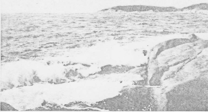
STALLARBUKTEN I STORM MOTIV FRÅN SÄRO (VÄSTKUSTENS PARLA)