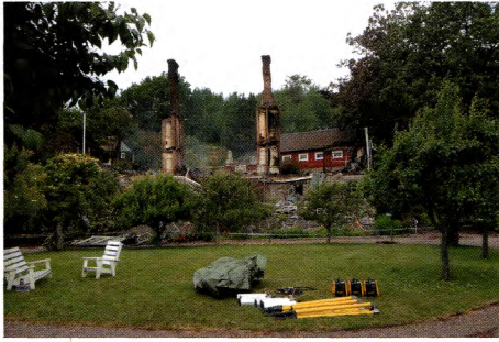
Kvar efter branden stod två pelare med kakelugnar.

Ett av dom pampigaste husen i Särö förstördes den här sommaren av en häftig brand. I dagsläget är det inte klarlagt vad som kommer att hända med det drygt 100 år gamla Hermansborg.