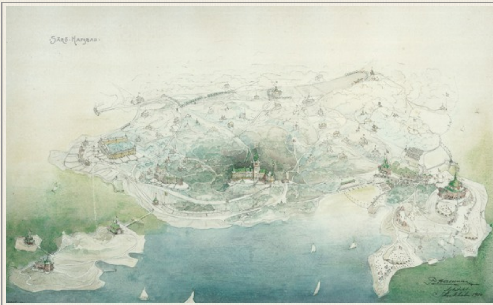
Särö Hafsbad. Akvarell av arkitekt Per Hallman.

na, och med dessa 160 000 invånare med den elektriska banan kan uppnås på en 1/2 timma och att Göteborgs invånare hava sin naturskönaste lättast tillgängliga och naturligaste förlustelseort på Särö, samt att Trollhättans vattenfall, som är bland de största och vackraste i världen och i varje fall näst Niagara det mest berömda från Särö kan nås på 2 timmars järnvägsresa, så finner man lätt att Särö har alla tendenser att bli en turistplats som få. ...”