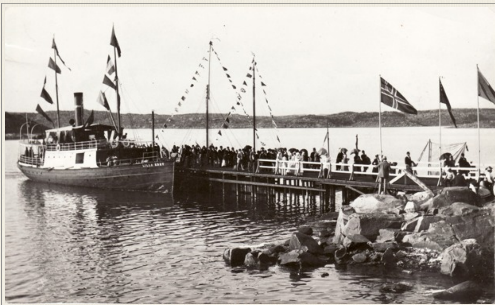
SS Lilla Edet (senare SS Särö) vid Nya bryggan i festskrud. Kung Oscar väntas.

300 000 kr. Denna gång var sommar-gästerna med på noterna och tecknade sig för 202 aktier à 1 000 kr – om de nu fann erbjudandet mer attraktivt eller hade större förtroende för styrelseledamöterna i Särö AB.