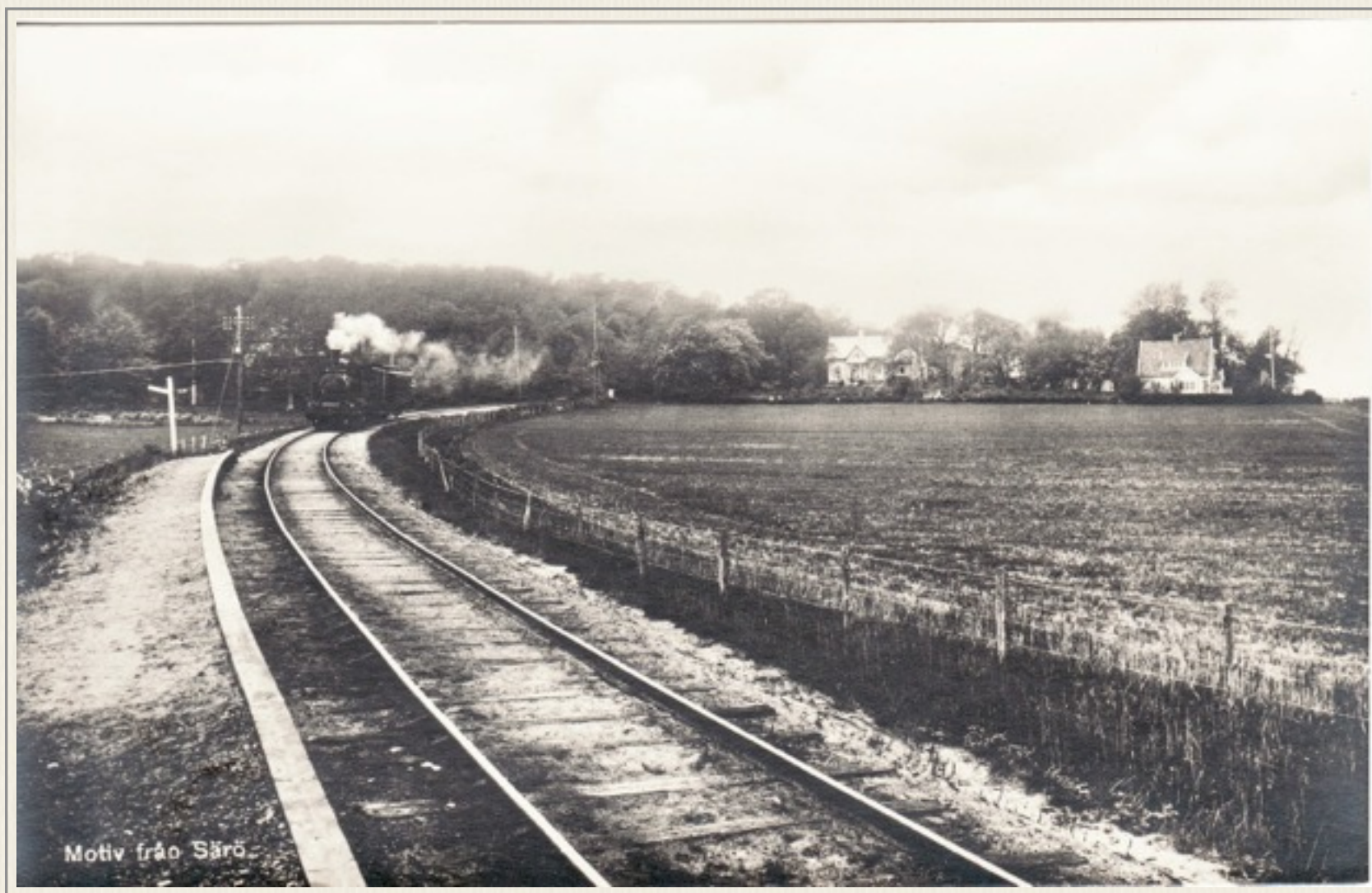
Motiv från Särö. Vy från Munkekullens station.