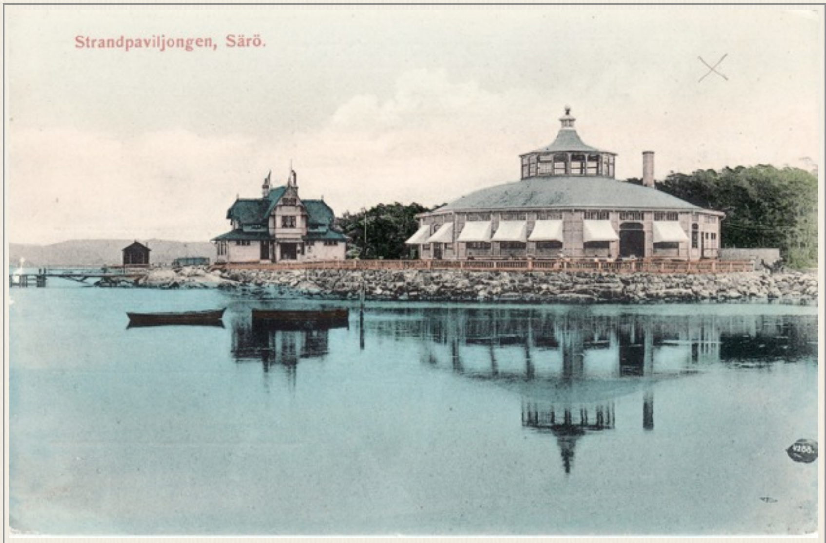
Strandpaviljongen. Särö Hafsbad's Restaurant.

Efter flera besök tillsammans med sin far gästade kronprins Gustaf Särö regelbundet från 1901 och deltog i de inter-