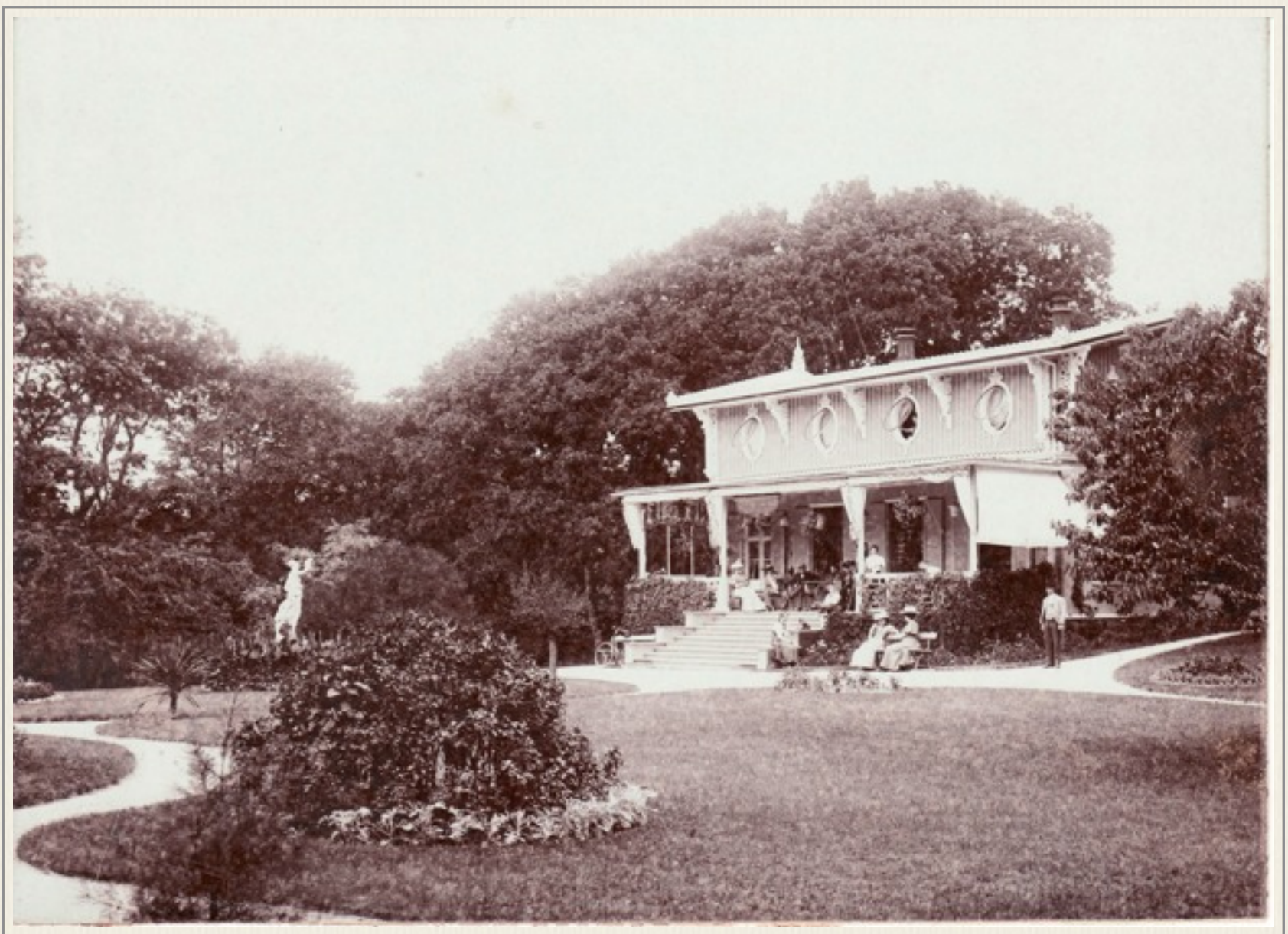
Villa Solsidan, troligen vid slutet av 1880-talet.

Han lät uppföra ett stort antal villor för privatpersoner ”på subskription”, d.v.s. han utarrenderade tomter och åtog sig enligt kontrakt att bygga villor på dessa. Arrendetiden kunde variera mellan 10 och 49 år och byggnaden tillföll jordägaren efter arrendetidens utgång, även om den uppförts av arrendatorn. Villorna fick endast disponeras sommartid och skulle oljemålas och tapetseras i enlighet med tidigare uppförda villor. Ett annat vanligt villkor var att arrendator inte fick bygga badhus eller annan byggnad.