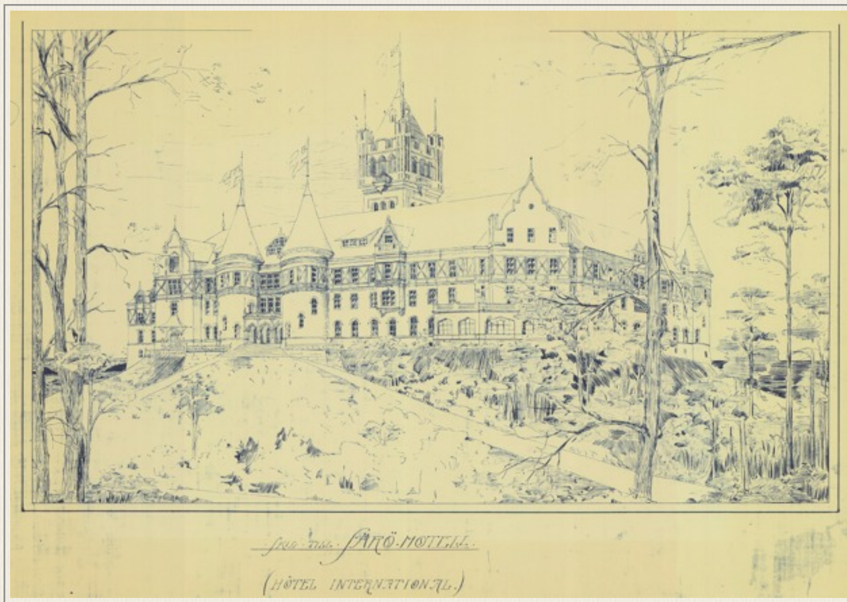
Skiss till Särö Hotell av arkitekt Per Hallman.

” När det gäller utvidgningen av Särö som havskurort har jag skriftligen satt mig i förbindelse med 55 av de största havskurorterna runt Medelhavs-, Atlant-, Nordsjö- och Östersjökusterna. Ytterligare komplettering med Amerika.”