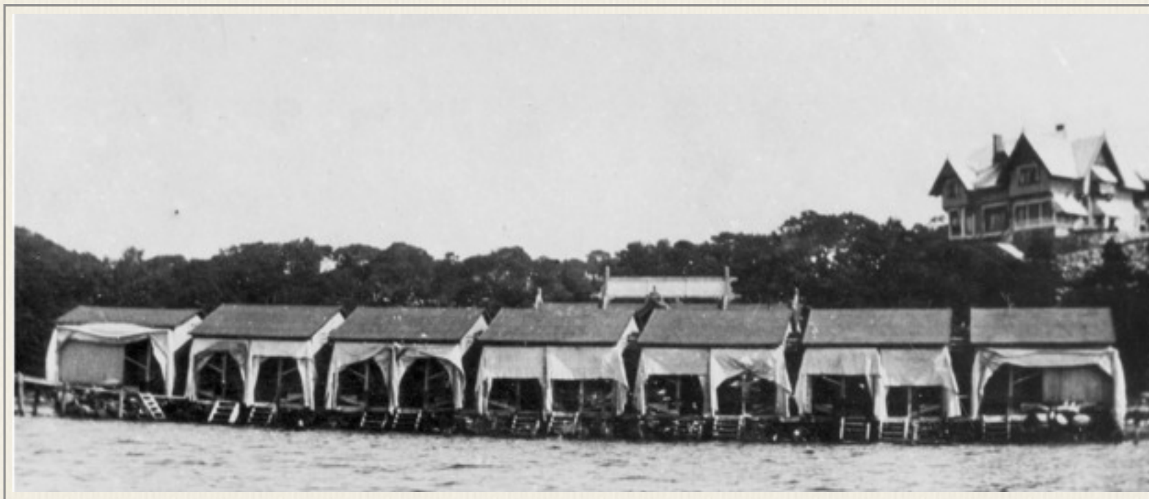
Dambassinerna 1900, Wikensborg i bakgrunden.

i form av enfamiljshus och flerlägenhetspaviljonger. De tidigaste villorna vid bassängbacken uppfördes sannolikt av Åkerman. Badhuset i Torbjörnsvi-