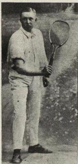
ETT SPÄNNANDE PARTI.